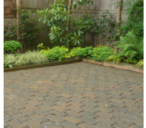
Adoquines permeables: Piedras, ladrillos o adoquines especialmente diseñados que permiten que el agua penetre en el suelo.